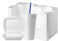
泡沫杯、容器或吸管