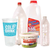
塑料瓶、杯子和容器