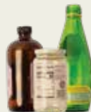
Botellas y recipientes de vidrio