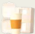
Vasos y recipientes de espuma