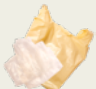
Bolsas de plástico