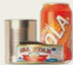
Latas de alimentos y bebidas