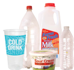
Botellas, vasos y envases de plástico