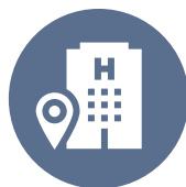
Mga Hotel at Lodging