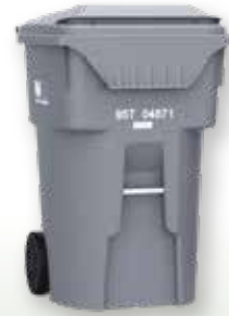
96-gallon Cart para sa Landfill