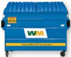
2-, 3-, 4-, at 6-cubic yard na Basurahan para sa Mga Nare-recycle

Sa mga property na may limitadong espasyo, available ang opsyon na pinaghating basurahan (mga nare-recycle at landfill).