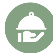
Mga Restawran at Catering