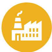
Mga Gusali ng Opisina at Manufacturing