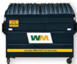
2-, 3-, 4-, at 6-cubic yard na Basurahan para sa Landfill