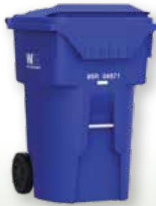
96-gallon Mga Recyclable Cart