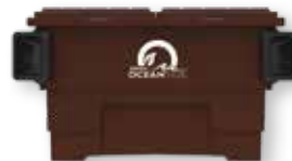
2-cubic yard na Basurahan para sa Pag-recycle ng Mga Tirang Pagkain