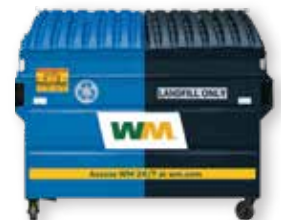
3-cubic yard na Pinaghating Basurahan para sa Mga Nare-recycle at Landfill

* Tandaan, dapat magkaroon ang mga negosyo na naglalabas ng basura mula sa bakuran o landscaping ng serbisyo sa green waste. Tingnan ang pahina 7 ng gabay para sa higit pang impormasyon.