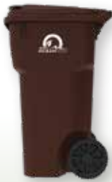
64-gallon Cart para sa Pag-recycle ng Mga Tirang Pagkain