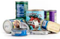
Latas de alimentos y bebidas