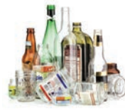
Botellas y recipientes de vidrio