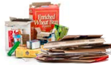
Cartones y cartulinas aplanadas

Coloque los materiales reciclables directamente en el carrito de reciclaje - No embolse los materiales reciclables.