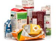
Cajas de alimentos y bebidas