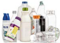
Botellas y recipientes de plásticos