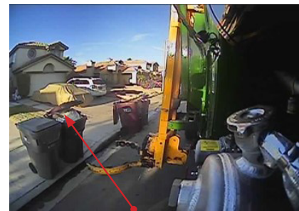
装得过满的垃圾车