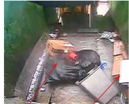
Bolsa de plástico