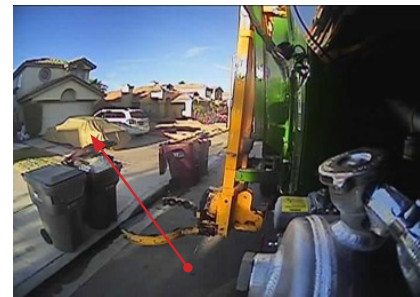
Labis na Pinunong Cart