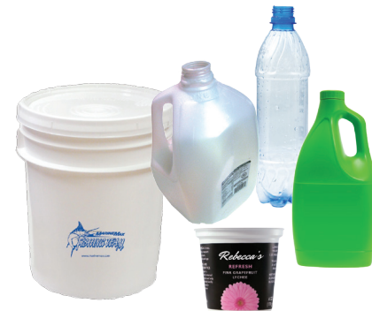
Botellas y contenedores plásticos vacíos

No coloque desechos domésticos peligrosos o desechos electrónicos en el bote de reciclaje. Para una manipulación correcta, vea el panel de desechos domésticos peligrosos.