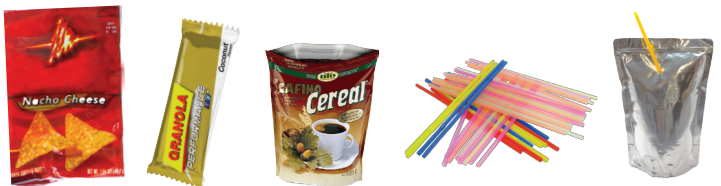
Envolturas para alimentos, sorbetos, y bolsas de jugos

No coloque desechos domésticos peligrosos o desechos electrónicos en el bote de basura. Para una manipulación correcta, vea el panel de desechos domésticos peligrosos.