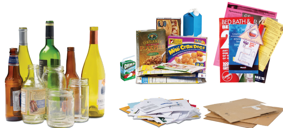
Botellas y frascos de vidrio vacíos

Si no sabe si un artículo es reciclable, arrójelo al bote de basura.