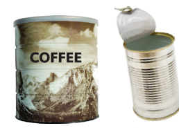
Latas vacías de aluminio, hojalata y acero