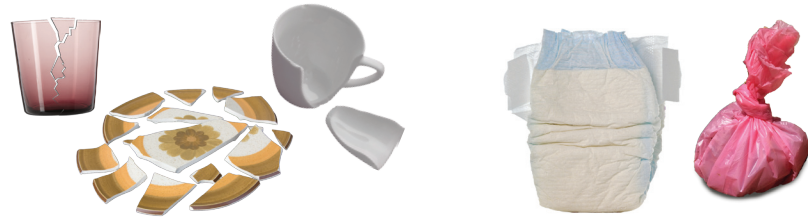
Cerámica y vidrios rotos